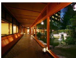
【山形県】 天童温泉 ほほえみの宿 滝の湯