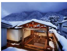
【新潟県】 弥彦温泉 四季の宿みのや