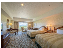
【岐阜県】 ホテルアソシア 高山リゾート