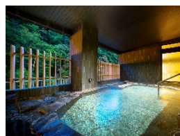
【神奈川県】 箱根湯本温泉 箱根パークス吉野