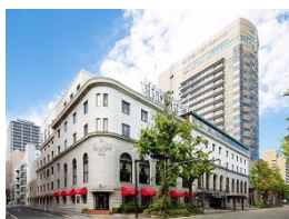
【神奈川県】 ホテルニューグランド