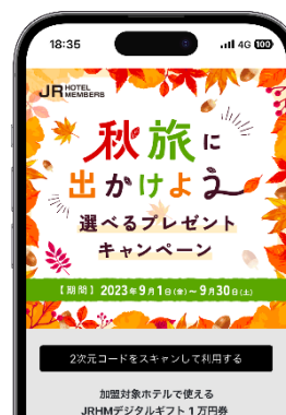
「選べるプレゼント」利用画面

【キャンペーンサイト】 詳しくはキャンペーンサイトよりご確認ください https://www.jrhotel-m.jp/special/autumn/autumn_index.html