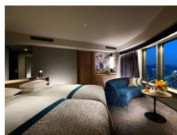
【岡山県】 ホテルグランヴィア岡山