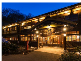
【青森県】 鳶温泉旅館