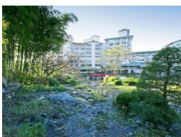
【宮城県】 秋保温泉 篝火の湯 緑水亭