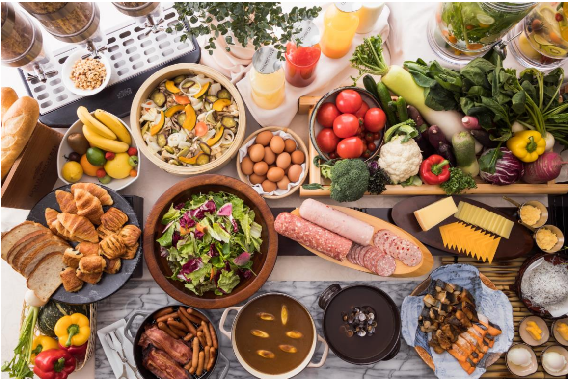
朝食ブッフェイメージ

この度料理長おすすめの朝食メニューが決定しました。ビタミンチャージはもちろん、地元食材も楽しめるぜいたくな朝をご提供します。