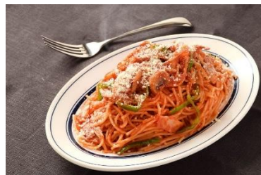
横濱発祥「ナポリタン」