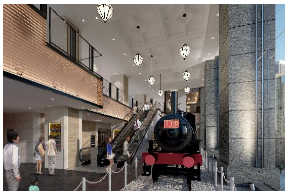
1階 旧横濱鉄道歴史展示「旧横ギャラリー」