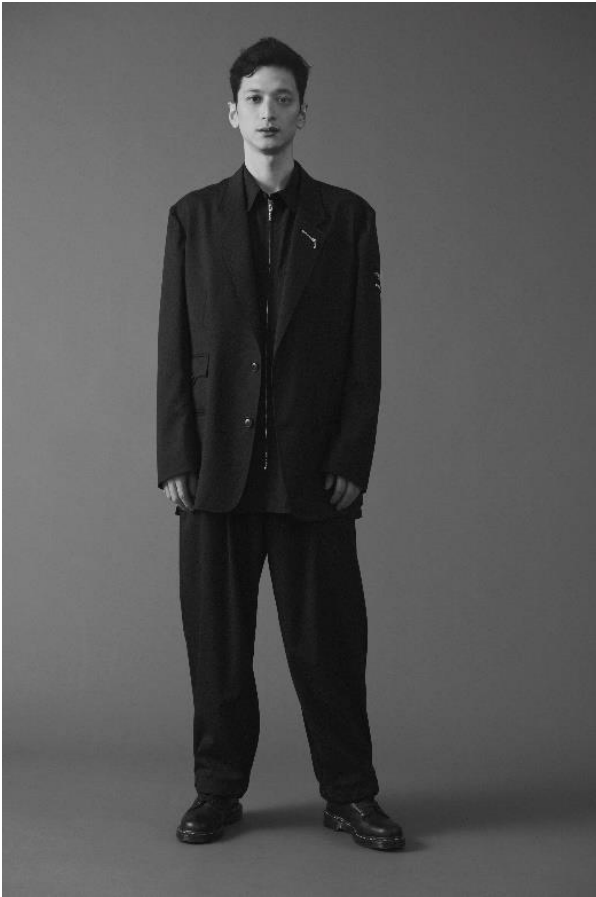
男性クルー着用イメージ(ジャケットあり)