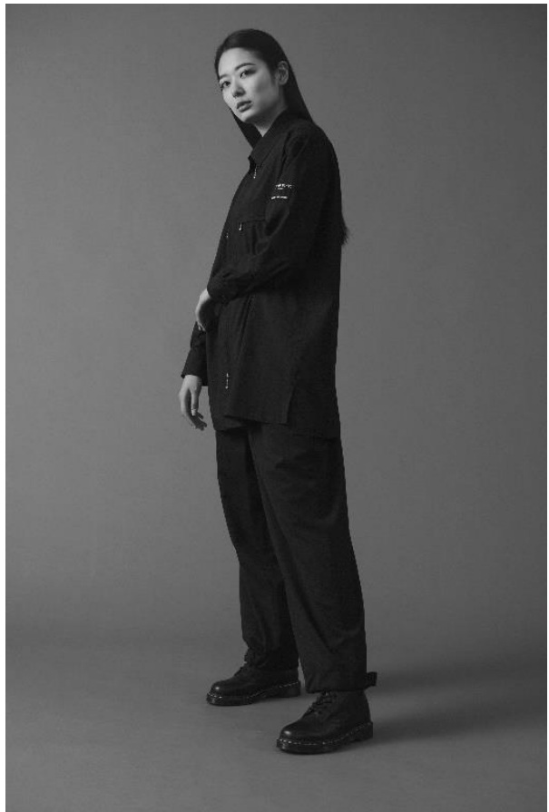
女性クルー着用イメージ(ジャケットなし)