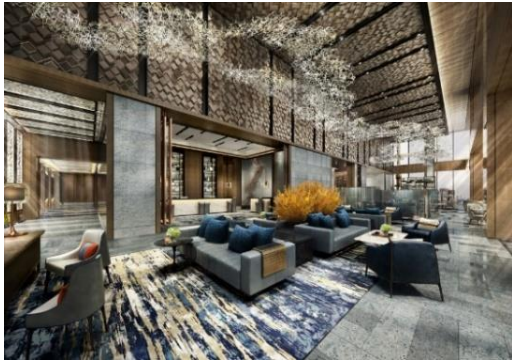
ホテルロビーイメージ

“TOKYO WAVES”をコンセプトに、絶えず変化する東京の“今”に根ざしたサービスやコンテンツを展開することによりゲストに新たな発見を提供する、次世代に向けた全265部屋のラグジュアリーなホテルです。壮麗な東京ベイエリアや歴史ある浜離宮恩賜庭園といった美しい眺望、そして五感にも心地よい刺激を与えるアートや音楽といった、豊かな地域資源と芸術の一体感を活かし、都会のエネルギ―とクリエイティビティーが会う東京のライフスタイルのアイコンを目指します。「Exactly like nothing else(唯一無二)」のホテルとして、マリオット・インターナショナルが展開する「オートグラフ コレクション」に加盟しています。