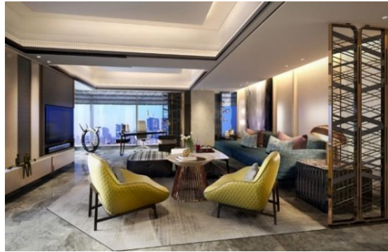
スイートルームイメージ