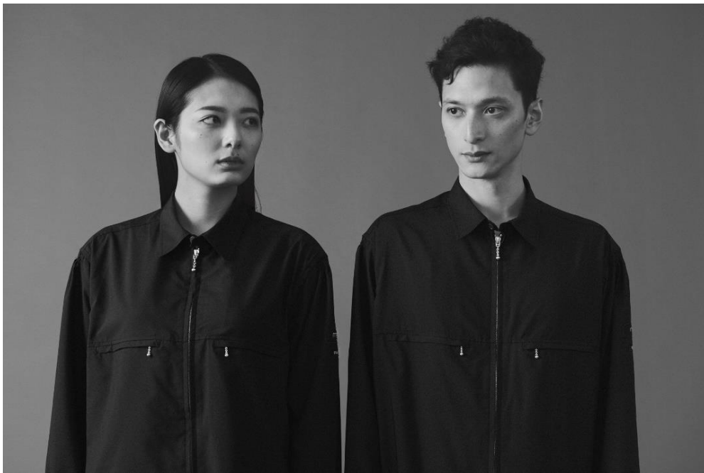
ジェンダーレスでスタイリッシュなデザインのブラウス

ユニフォームのコンセプトは、一つのサイズで幅広い体格の人が快適に着用することができ、それを着る人によって全く異なる雰囲気や表情といった“味わい”をみせる「ジェンダーレス」。多様化するジェンダーに応える形で、女性・男性スタッフが同じデザインの制服を着用するという新しい方向性と合致し、Y's のユニセックスラインである Y's BANG ON!とのコラボレーションが実現しました。従来のホテルマンのイメージを一新するような、クルー一人ひとりの個性が際立ち、年齢・性別・国籍の枠にとらわれない自分らしさが輝くようなユニフォームに仕上がりました。