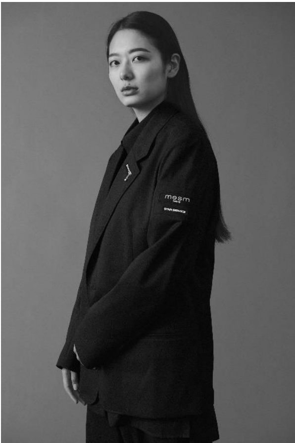
女性クルー着用イメージ(ジャケットあり)