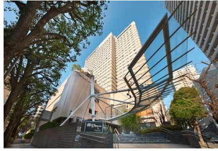
ホテルメトロポリタン（池袋）