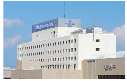
ホテルメトロポリタン 高崎