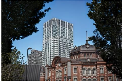
ホテルメトロポリタン 丸の内