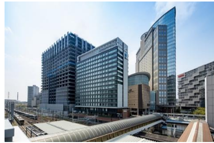
ホテルメトロポリタン 川崎