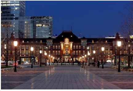
東京ステーションホテル