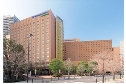
ホテルメトロポリタン エドモント