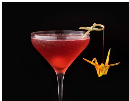
最優秀カクテル「優雅 ～美しき和の心～」イメージ

選ばれた最優秀カクテルは 2 か月間、首都圏だけでなく東日本地域に広く根づくメトロポリタンホテルズ及び東京ステーションホテルのバーやレストランにてご賞味いただけます。