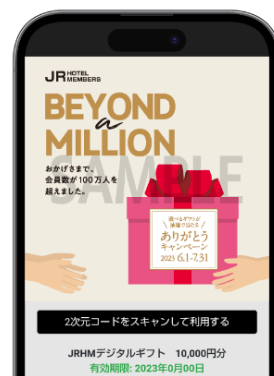
JRHM デジタルギフト イメージ