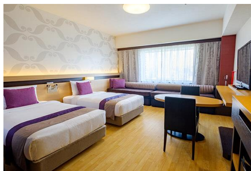
イーストウイングファミリールーム