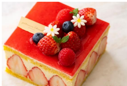
いちごのホールケーキ「フレジエ」4号サイズ