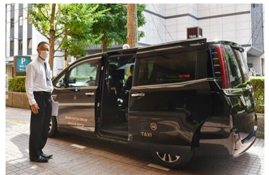
4名利用の場合は「トヨタ エスクエア」で広々バス