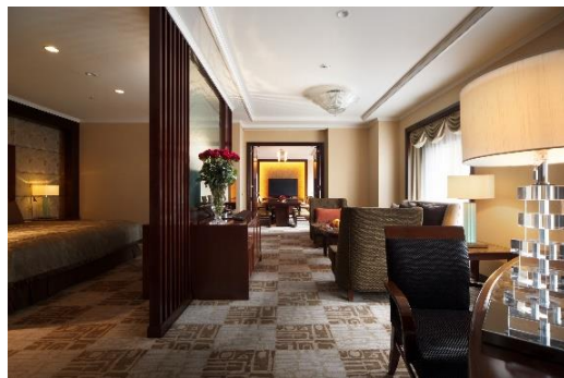
メトロポリタンスイート