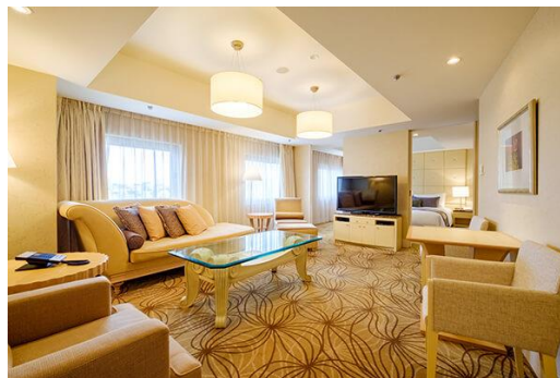
エドモントスイート