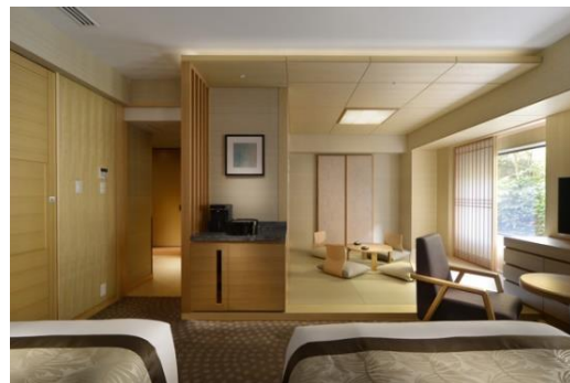
ジャパニーズスイート（和洋室）