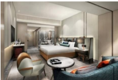
ゲストルームイメージ(チャプター1・2)

またメズム東京では、五感を魅了する体験を提供するために、JAPAN QUALITY にこだわったコラボレーションとして、メンズスキンケアブランド“BULK HOMME(バルクオム)”プロデュースのオリジナルバスアメニティ、「たった一杯で、幸せになるコーヒー屋」がモットーの“猿田彦珈琲”によるオリジナルブレンドのスペシャルティコーヒー、日本を代表する電機メーカーであるカシオ計算機の、スタイリッシュなデザインかつグランドピアノのような豊かな音色の電子ピアノ“Privia(プリヴィア)”を全客室に導入いたします。