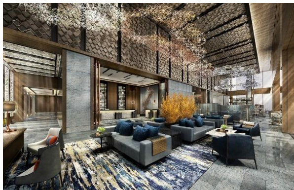
ホテルロビーイメージ