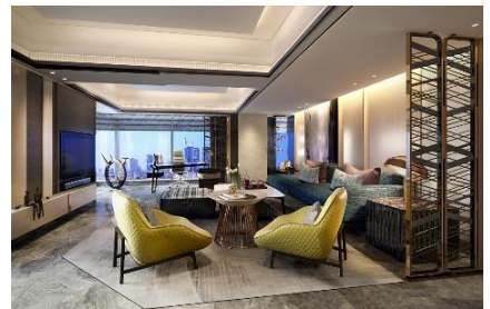
ゲストルームイメージ(チャプター4)