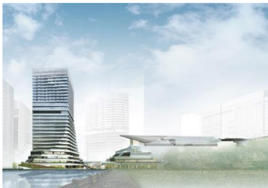
「WATERS takeshiba(ウォーターズ竹芝)」外観イメージ

メズム東京では、“TOKYO WAVES”をコンセプトに、東京の“今”に根ざした、ゲストの五感を心地よく魅了するオリジナルな体験の提供だけでなく、豊かな竹芝の地域資源と芸術の一体感を活かし、都会のエネルギーとクリエイティビティーが会う東京のライフスタイルのアイコンとなることを目指します。