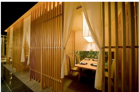
日本料理「花むさし」