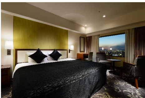
客室(シティビューフロア)