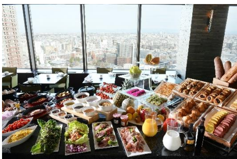
ダイニング&バー「オーヴェスト」朝食