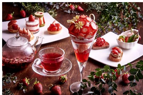
オールデイダイニング「クロスダイン」アフタヌーンティー