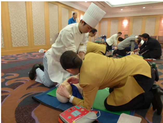
宴会場での従業員講習

ホテルメトロポリタンは全社員数 460 名の約 9 割が救命講習受講者であり、年 4 回更新の講習を当ホテルの宴会場及び消防署にて実施しています。平成 23 年 9 月に「救命講習受講優良証」の交付、平成 30 年度には委嘱状の交付を受け、事業所の応急手当普及員による救命講習を自主開催し、積極的に救命講習に取り組んでいます。また、施設には主要な階層及びテナントに AED を 10 台設置して傷病者発生時の救護計画を整備するなど、利用していただくお客さまが安心してホテルを利用できるように応急救護体制の構築を図っています。1985 年の開業時から救急要請時の対応訓練も継続し、外国人利用客の対応には通訳可能なホテル従業員が、積極的に救急活動を行っています。